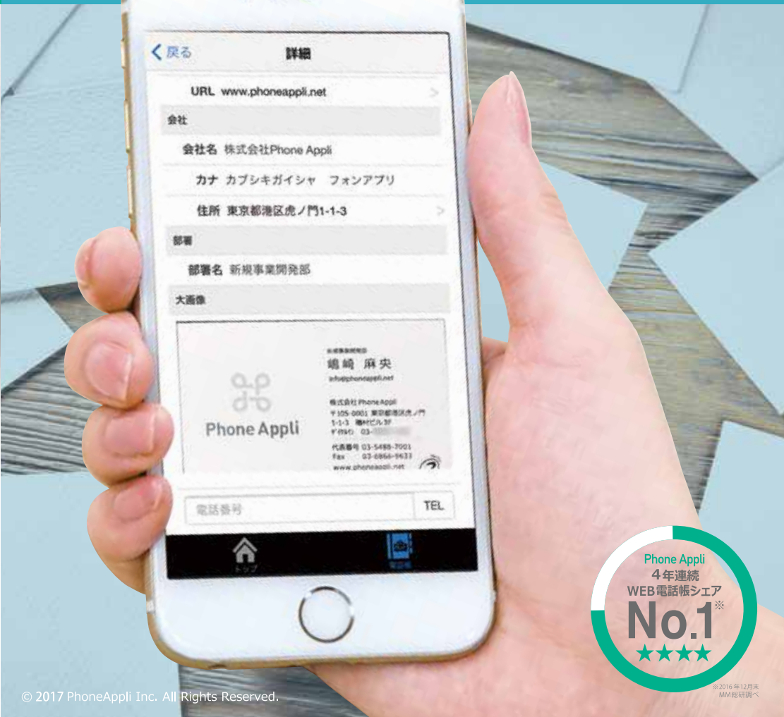
© 2017 PhoneAppli Inc. All Rights Reserved.