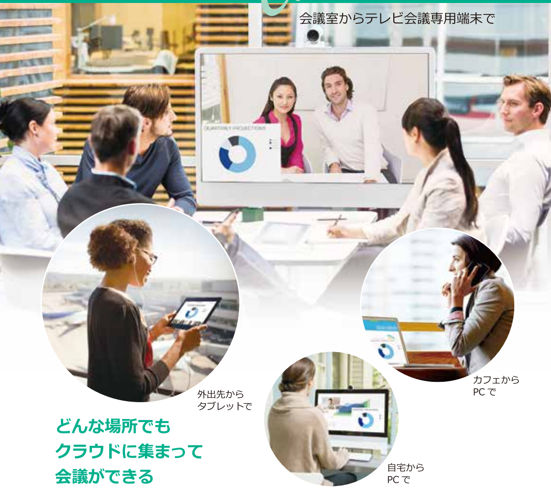
会議室からテレビ会議専用端末で